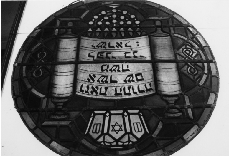
Raam uit de synagoge in Enschede: het Jodendom is zeer terughoudend in het afbeelden van mensen en dieren.

Waarom dit verbod? En dan ook met die strenge bepaling