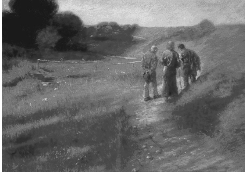
Fritz von Uhde (1848-1911): 'Der Gang nach Emmaus' (1891)

Minstens drie keer heeft Jezus het aangekondigd over Zichzelf: 'Ik ga nu naar Jeruzalem, want de Zoon des